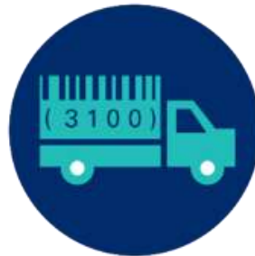
Μεταφορές & Logistics