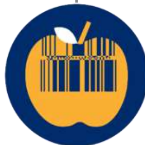
Τυποποιημένα Φρέσκα Προϊόντα