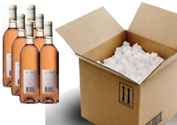
Χαρτοκιβώτιο με 6 φιάλες κρασί ροζέ Κωδικός GTIN-14 05211234000048 ή Κωδικός GTIN-14 15211234000021