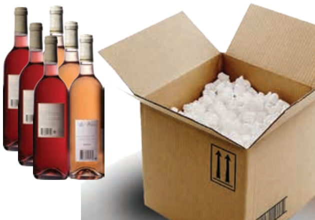
Χαρτοκιβώτιο με 3 φιάλες κρασί από κάθε είδος Κωδικός GTIN-14 05211234000031